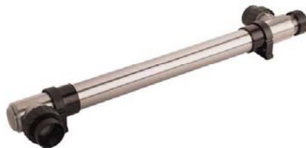
40 - 75 watt