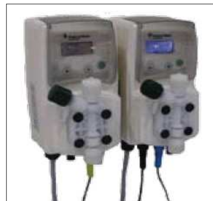
ph / ORP